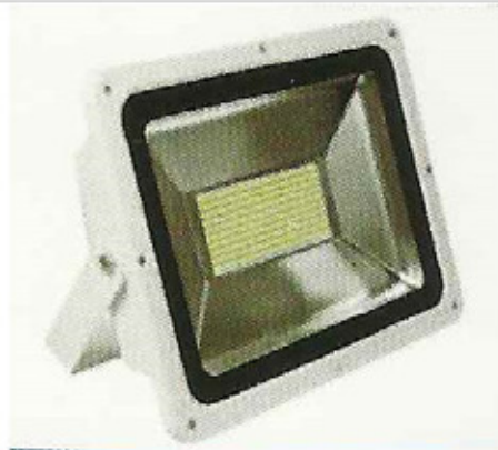
Apto para Uso interior y exterior